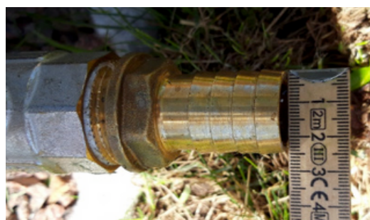
La dimension du robinet de vidange est de 25 mm.