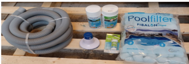
Le système de pompe et de filtration