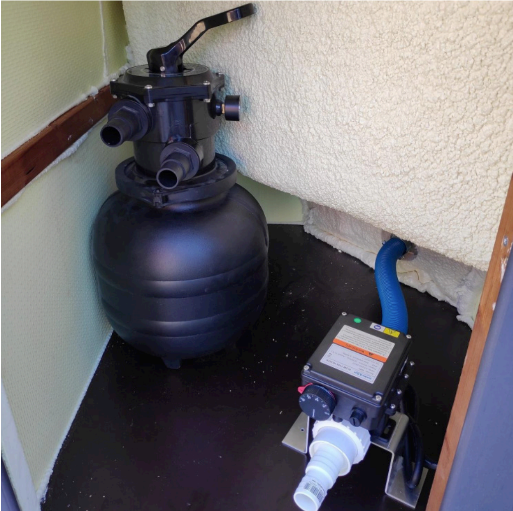
Kuva 8: Pumppujärjestelmän asennus

4. Asenna pumppujärjestelmä laitekaappiin kuvan 8 mukaisesti. Pumppujärjestelmän asennuksen yhteydessä katso pumppujärjestelmän käsikirja.