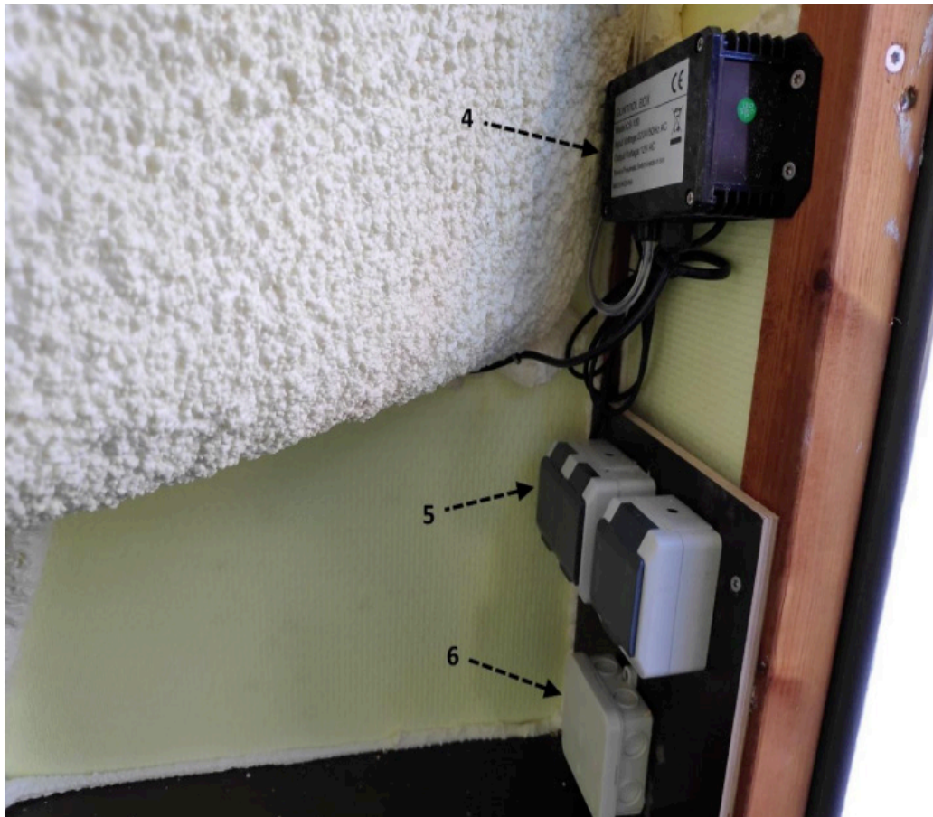
Kuva 5. Laitekaapin sisältö

Laitekaapin virransyöttö kuvan 5 mukaisesti on asennettava ammattilainen eli sähköasentaja. Asennuksen sähköinen osa on suoritettava voimassa olevien määräysten ja standardien mukaisesti.