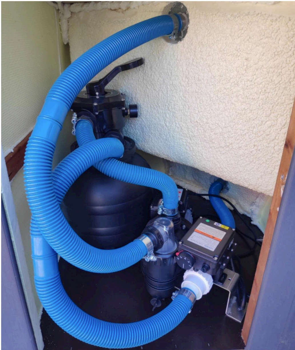
Kuva 9: Letkujen asennus