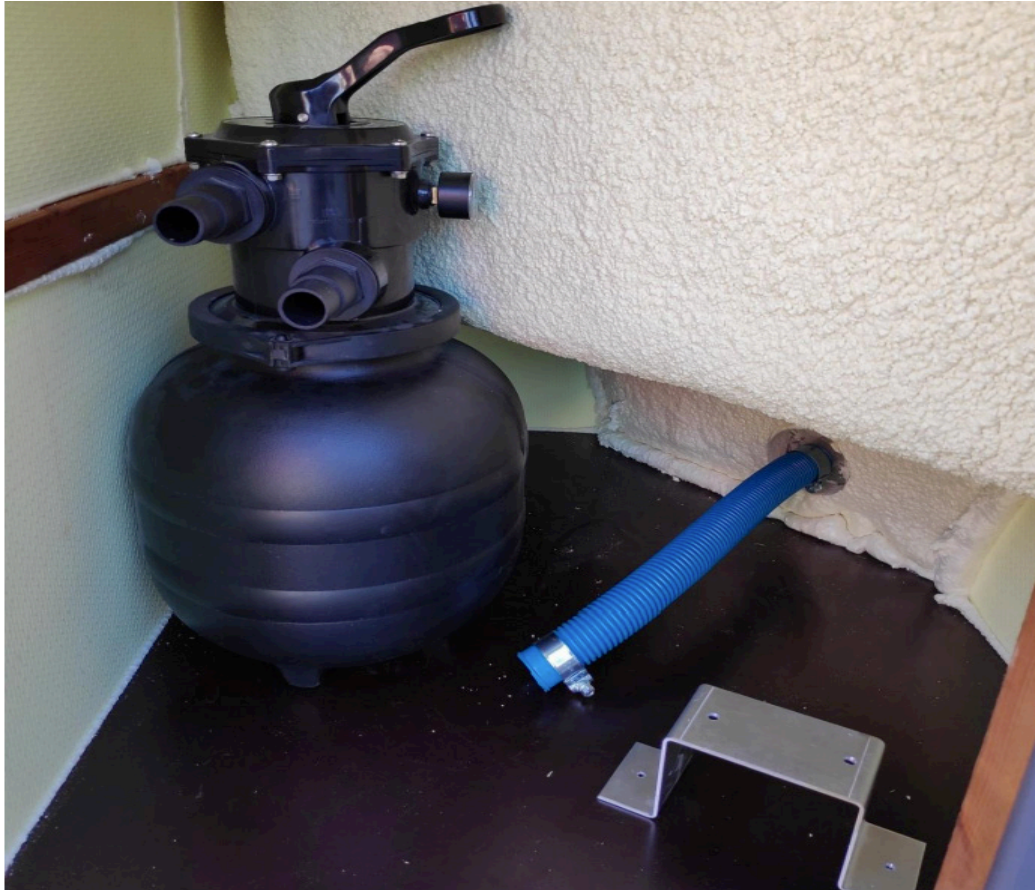
Kuva 6: Lyhyen letkun ja suodatinjärjestelmän asennus