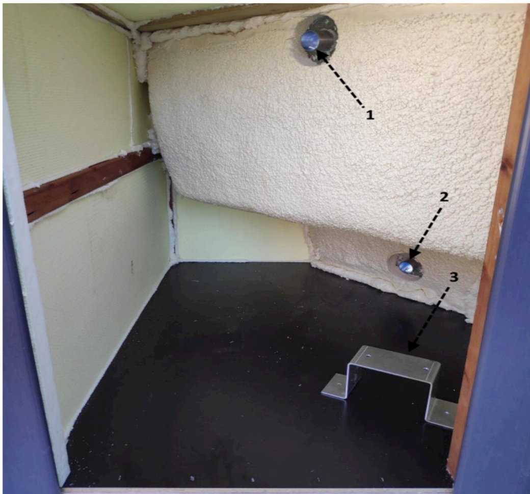
Kuva 4. Laitekaapin sisältö