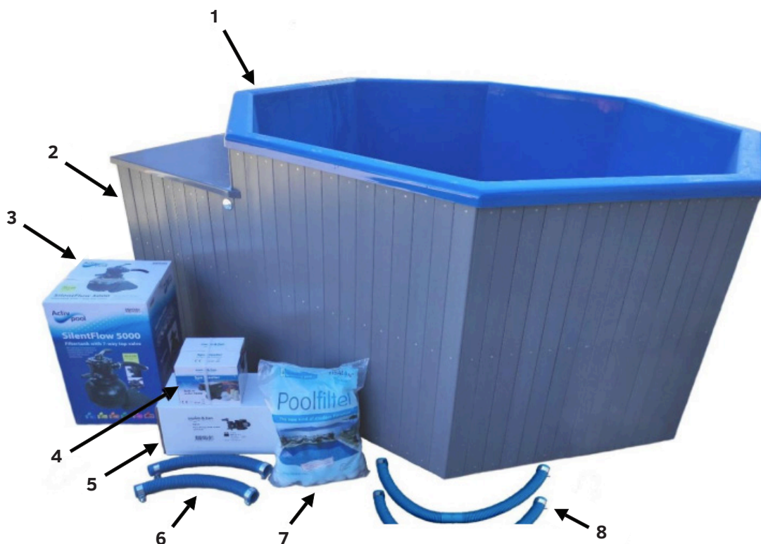
Kuva 1: Pakkauksen sisältö