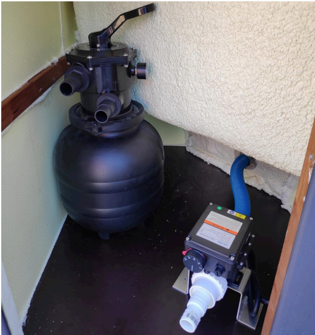
Kuva 7: Sähkölämmittimen asennus